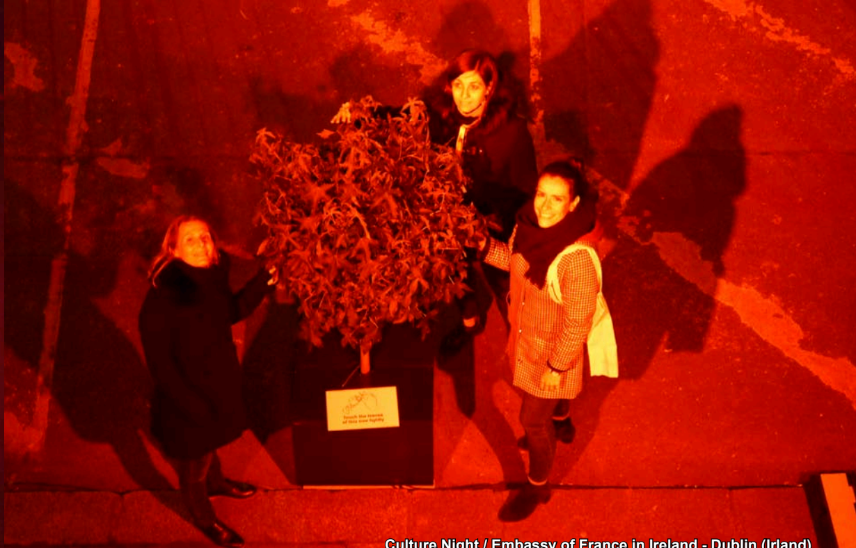
Culture Night / Embassy of France in Ireland - Dublin (Ireland)