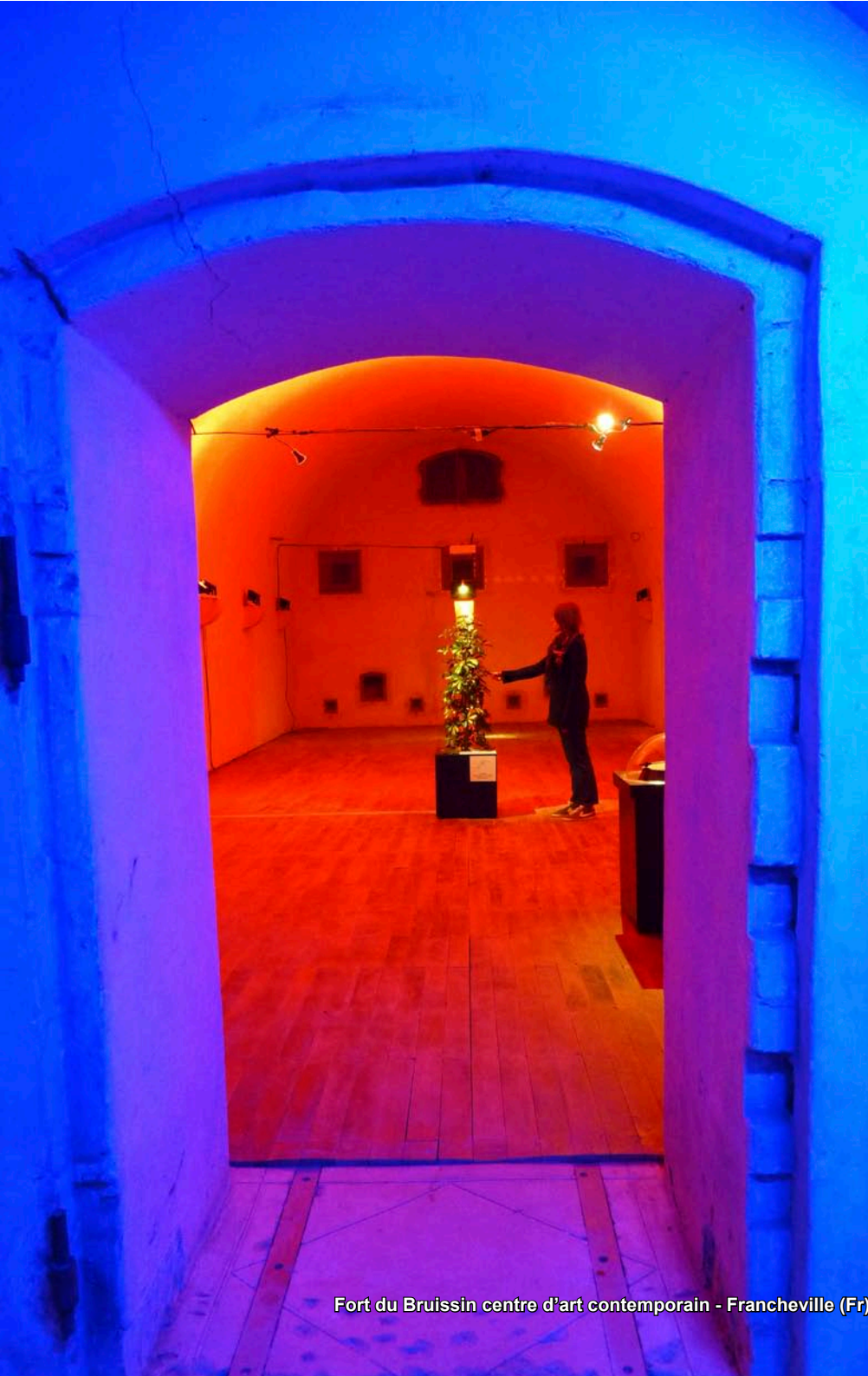
Fort du Bruissin centre d'art contemporain - Francheville (Fr)