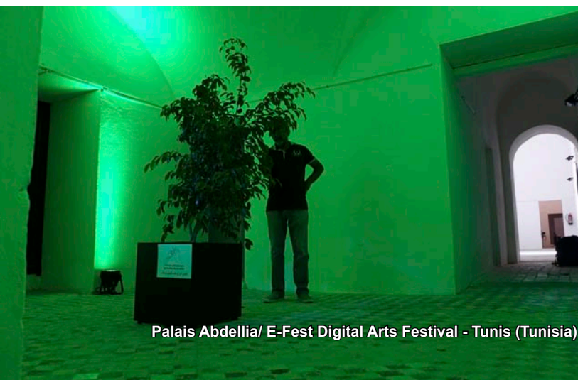
Palais Abdellia/ E-Fest Digital Arts Festival - Tunis (Tunisie)