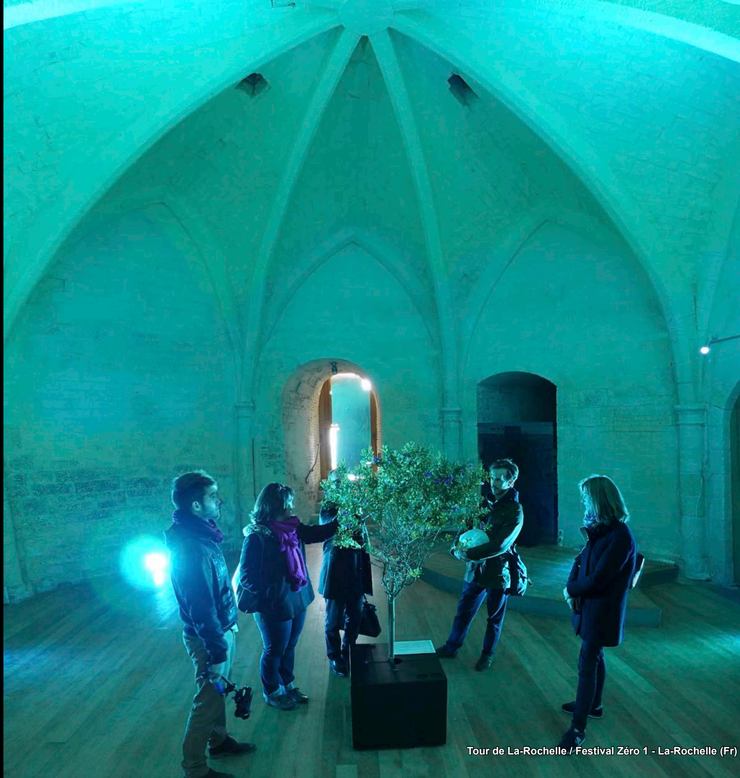
Tour de La-Rochelle / Festival Zéro 1 - La-Rochelle (Fr)