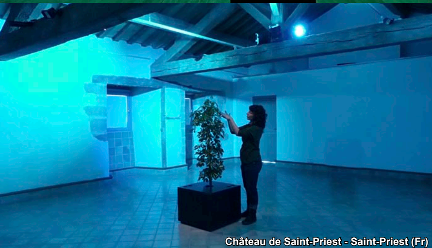
Château de Saint-Priest - Saint-Priest (Fr)