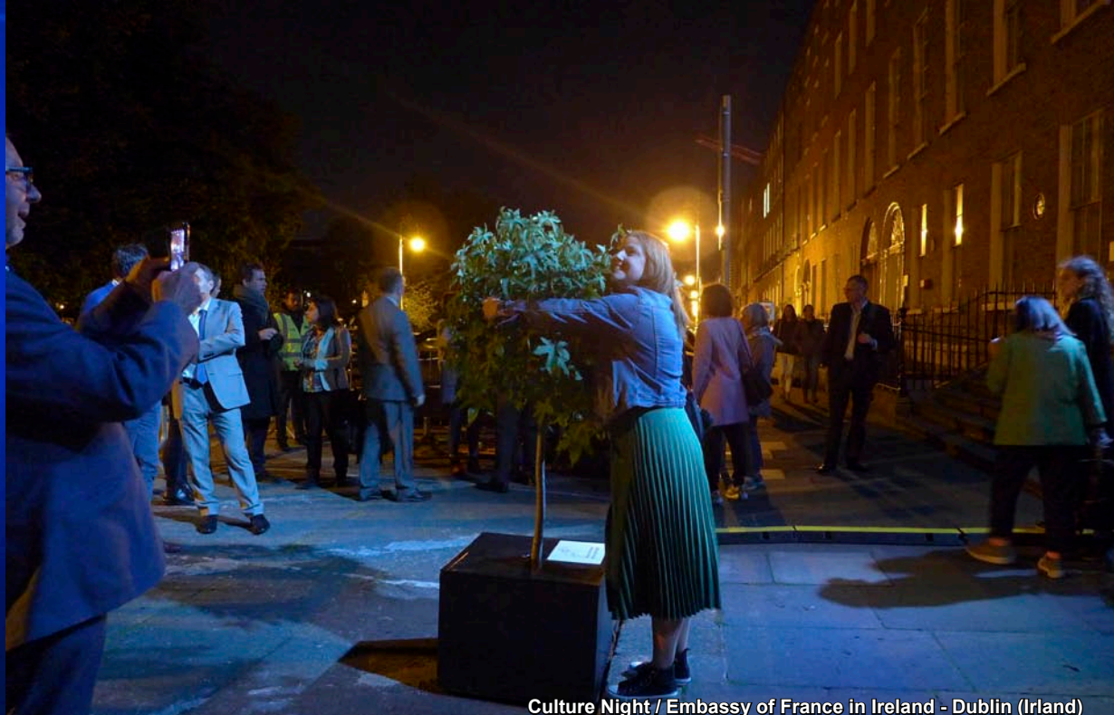
Culture Night / Embassy of France in Ireland - Dublin (Ireland)