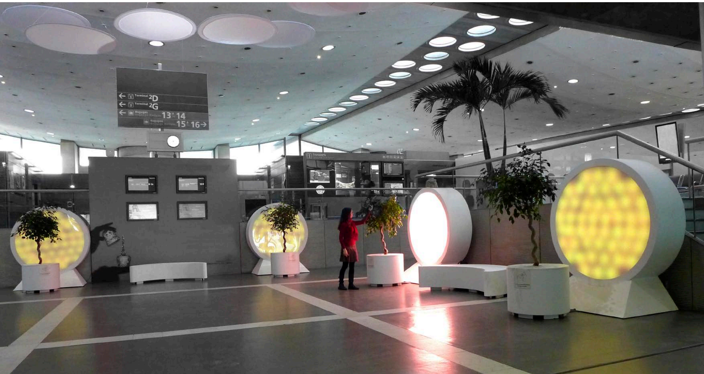
Lumifolia / Aéroport Roissy Charles de Gaulle / Commande publique / Digitalarti / Aéroports De Paris (Fr)